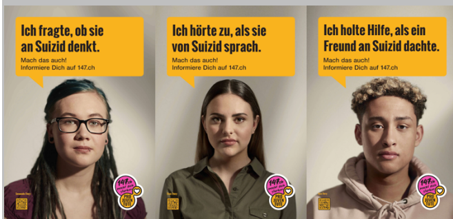
Abbildung 2. Poster der Jugendkampagne

Ende Jahr hat Prävention und Gesundheitsförderung Kanton Zürich in Zusammenarbeit mit Pro Juventute Online-Anzeigen für www.147.ch/de/suizidpraevention geschaltet. Anfang 2020 und im Dezember 2020 waren zudem im ganzen Kanton die Plakate der Kampagne für junge Menschen (16 bis 30) ausgehängt. Darauf werden junge Menschen durch Peers aufgefordert, Freunden mit Suizidgedanken zuzuhören und Hilfe zu holen. Eine Evaluation im Februar 2020 zeigt, dass 73% der Zielgruppe die Kampagne kennen. Der Plakataushang bei Pro Juventute führte zu einer Zunahme (in der Grössenordnung von rund 30-50%) der Beratungen zum Thema Suizidalität.